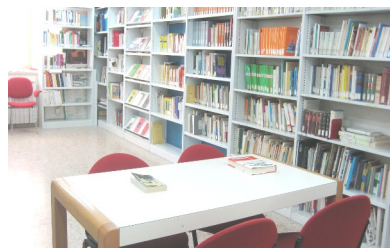
Sezione Pedagogia, Psicologia, Didattica