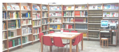
Sezione Opere di consultazione