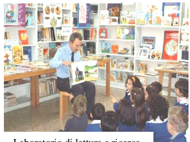
Laboratorio di lettura e ricerca