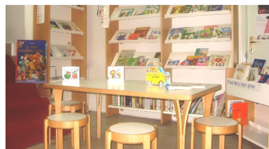
Sezione Ragazzi / Primi libri e libri-gioco